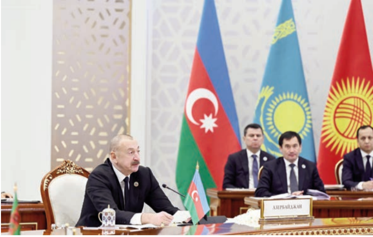
(Əvvəli 2-ci səhifədə)

Dünən biz İslam Sivilizasiyası Mərkəzini ziyarət etdik. Özbəkistan Prezidentinin təşəbbüsü ilə yaradılan bu Mərkəz Özbəkistan Prezidentinin ölkənin zəngin mədəni irsinə sadiqliyinin daha bir göstəricisidir. Bəzi ölkələrdə dinimizə qarşı hücumların artdığı bir şəraitdə islamofobiya sistemli xarakter alır. İslam Sivilizasiyası Mərkəzinin açılması bütün dünyaya göstərir ki, İslam quruculuq, dözümlülük, dostluq və qardaşlıq dinidir. İslam aləminin görkəmli nümayəndələri dünya elminə, mədəniyyətinə böyük töhfə veriblər və İslam Sivilizasiyası Mərkəzi bunu əyani şəkildə nümayiş etdirir. Əminəm ki, möhtəşəm və nadir ekspozisiyaları olan Daşkənddəki İslam Sivilizasiyası Mərkəzi bütün İslam dünyası üçün qürur mənbəyinə çevriləcək.